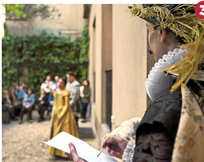
TEATRO. EN CASA DE LOPE.